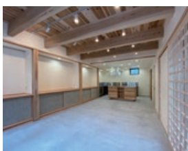
1F キッチン付き多目的スペース