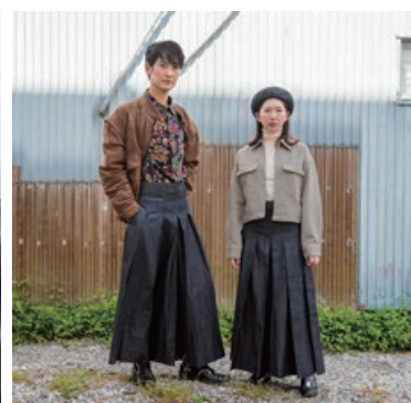
着物の枠を超え、自由な着こなしが楽しめるデニムきものとデニム袴パンツ。じいんず工房大方(黒潮町)とのコラボで商品化しました。